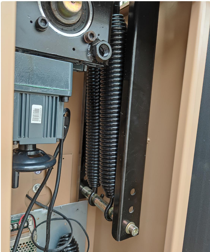
保持6.8弹簧跟5.5弹簧上紧即可