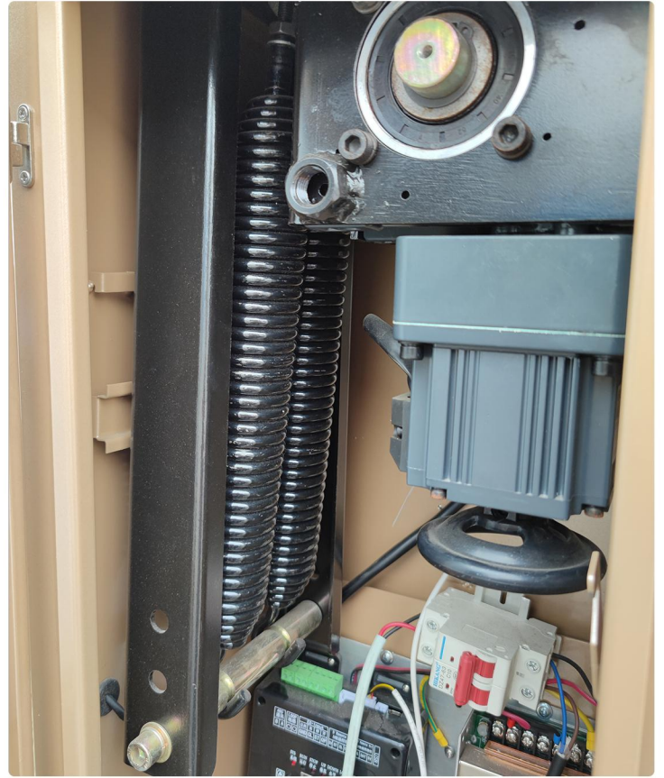
6.8+6.8弹簧保持上紧即可 能够插入0.5mm的铁片