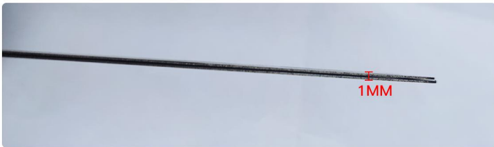
两块铁片厚度为1毫米