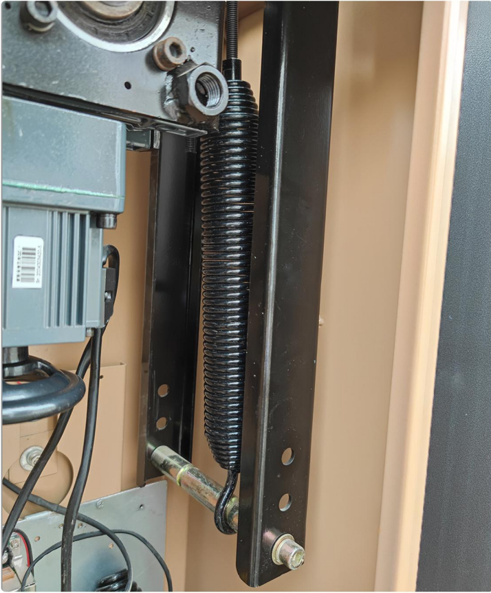
保持4.5弹簧上紧不要抖即可